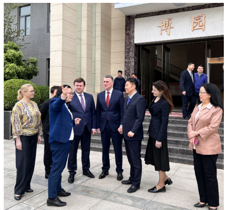
● Глобализация высшего образования стала толчком для создания альянсов между университетами

закладывается гармонично развитая территория, позволяющая заниматься спортом, социальными проектами и отдыхом. На мой взгляд, китайские кампусы — это отдельный предмет изучения.