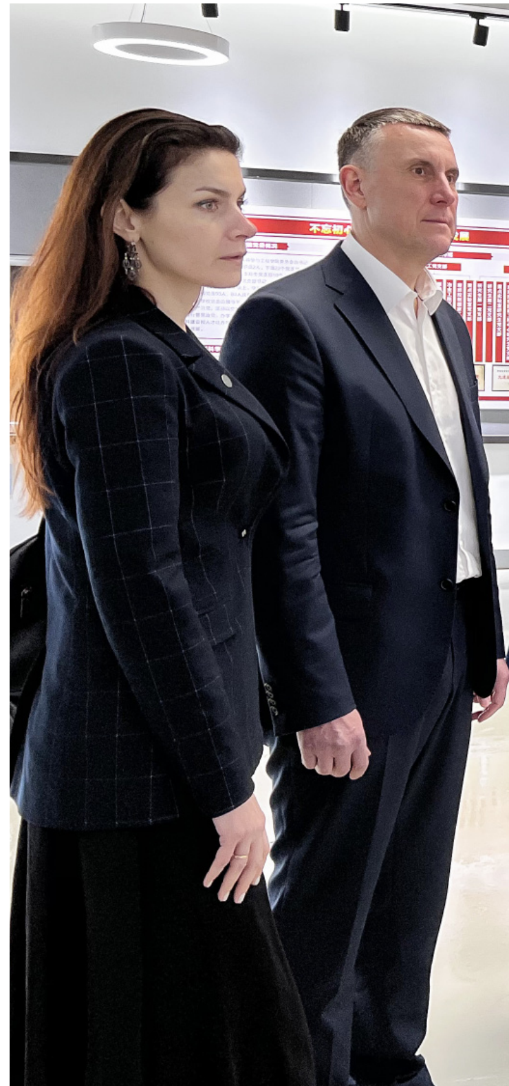
● В Китае проявили большой интерес к городу-университету