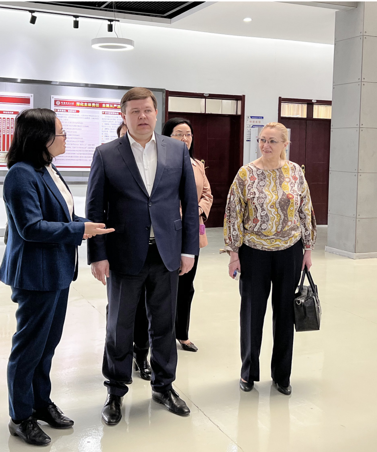
из-за его древней истории и современной промышленности

и вузе под работу на валовой региональный продукт. Мы рассчитываем, что каждый второй житель Великого Новгорода, обучающийся, сотрудник организаций будет так или иначе соприкасаться с деятельностью НовГУ. Мэр подтвердил поддержку университета по всем вопросам. Великий Новгород будет сотрудничать с обоими городами в сфере предпринимательской деятельности и бизнеса, туристического и культурного обмена. В ближайшее время мы направим ещё одну делегацию в Китай для уточнения деталей сотрудничества.