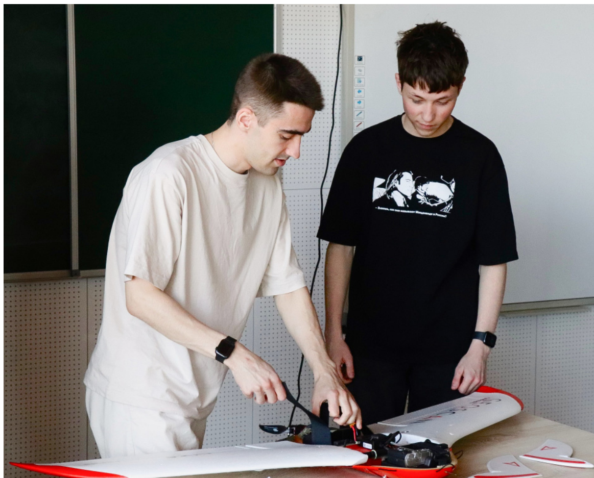
● Студенты учились управлять беспилотниками