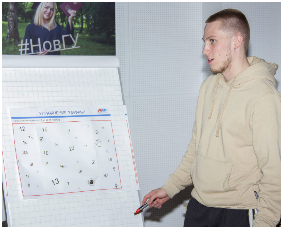
● В форме игры изучали правило 5С для экономики