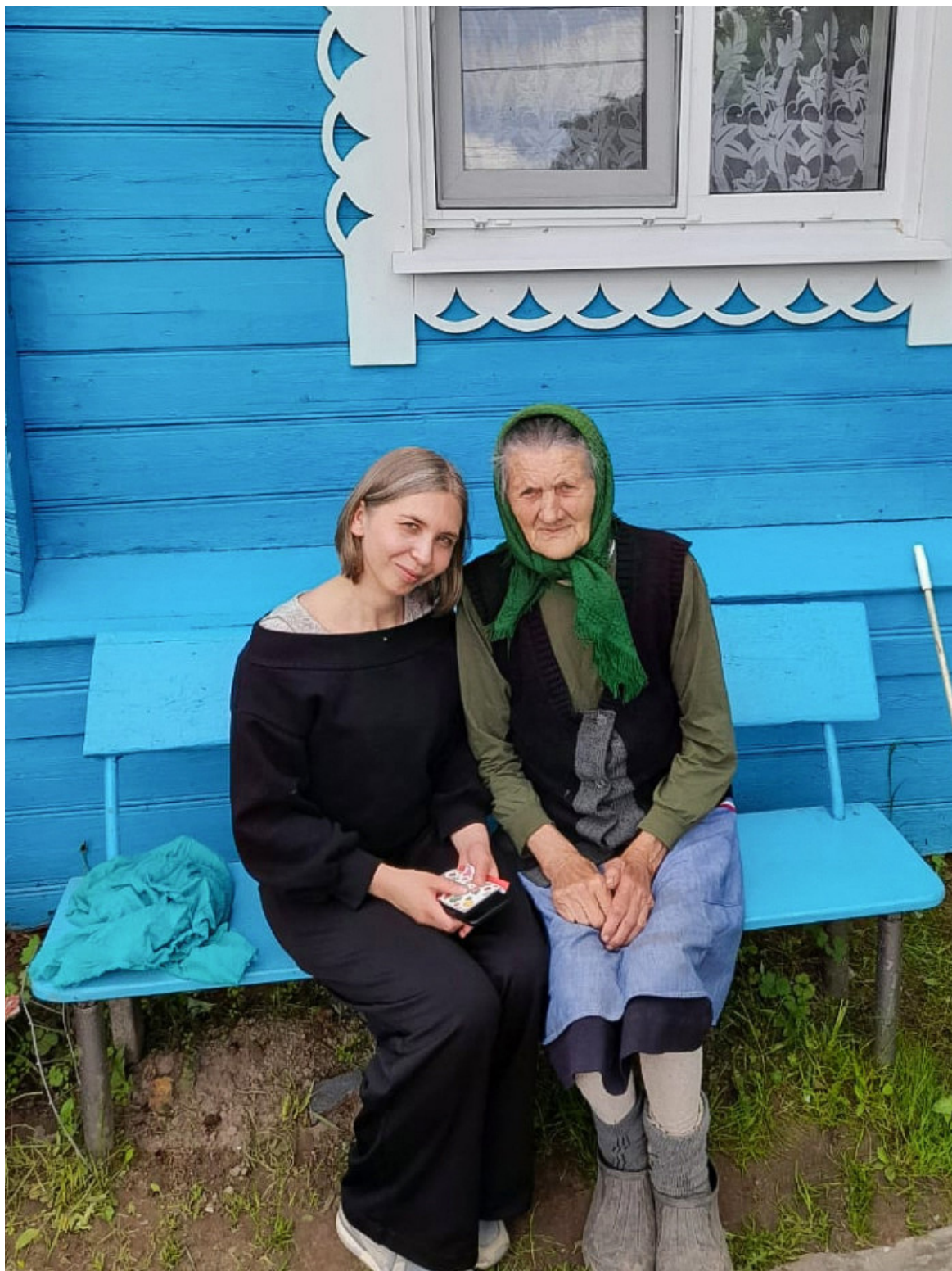
● Некоторые «информанты» стали близкими людьми